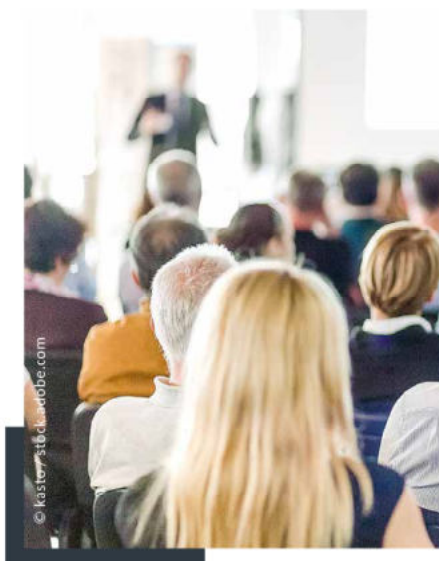
Weiterbildung im Bereich der Seelsorge

VOR ORT SIND DIE UNTERSCHIEDE GERINGER, ALS VIELE DENKEN.